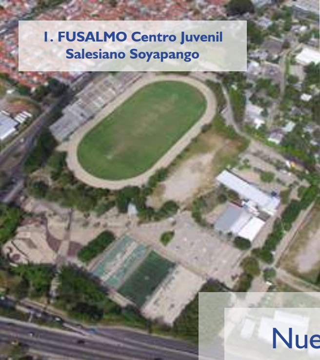
1- FUSALMO Centro Juvenil Salesiano Soyapango