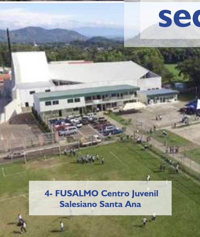
4- FUSALMO Centro Juvenil Salesiano Santa Ana